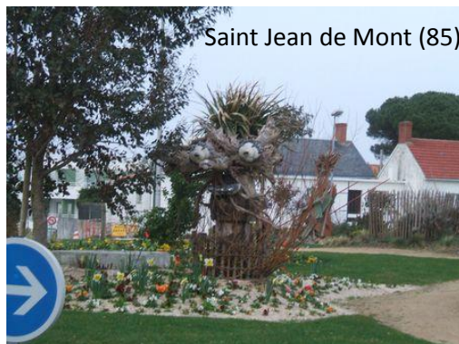
Saint Jean de Mont (85)