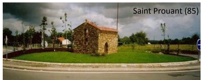
Saint Prouant (85)